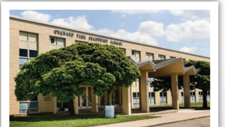
Orchard Park Ortaöğretim Okulu