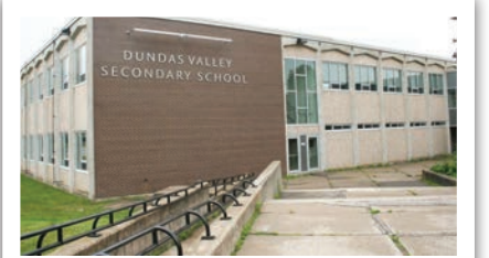
Dundas Valley Ortaöğretim Okulu