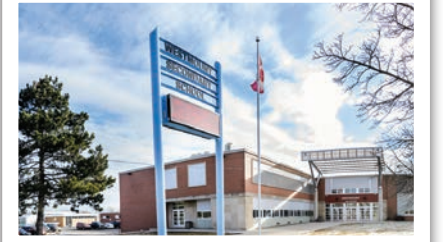
Westmount Ortaöğretim Okulu